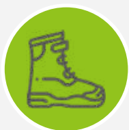
CHAUSSURES DE SÉCURITÉ