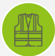
VÊTEMENTS DE HAUTE VISIBILITÉ